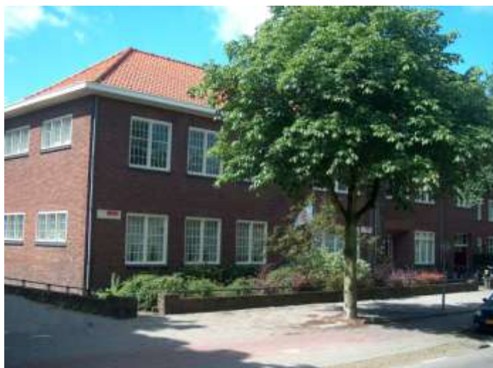
Het Iber Lengua trainingscentrum in Haarlem